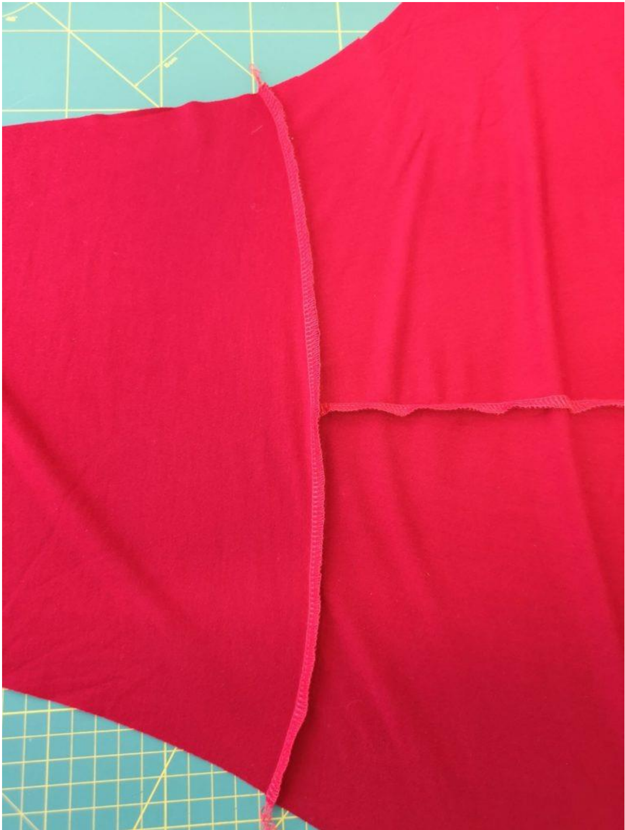
6. Detail našití rukávu